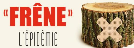
Image de marque de la campagne de sensibilisation

La compagnie d'élagage retenue par la Ville lors de son appel d'offres pour l'abattage des frênes publics est en mesure de couper les frênes en billots et de les transporter au site de dépôt, tel que l'exige la Ville dans la perspective de valoriser le bois.