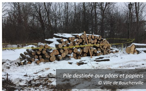
Pile destinée aux pâtes et papiers

La Ville de Boucherville, située dans l'agglomération de Longueuil, en Montérégie, a valorisé de plusieurs façons les 425 frênes qu'elle a abattus à l'hiver 2016-2017 : 1) vente à l'industrie des pâtes et papiers en collaboration avec la Ville de Longueuil, 2) projet pilote concernant les billes non standards avec un scieur, et 3) copeaux utilisés dans les aménagements municipaux et vendus comme biomasse. L'année précédente, une partie des 150 frênes abattus a été transformée en planches par une scierie mobile et des copeaux avaient été distribués aux citoyens. À propos des frênes privés, la Ville a mis en œuvre 1) une campagne de communication, 2) des subventions au traitement, 3) un service de déchiquetage et de ramassage de branches ainsi que 4) un partenariat avec les écocentres de l'Agglomération.