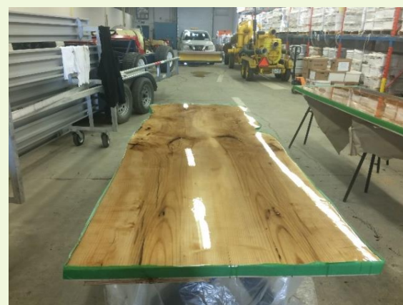
Les tables en frêne réalisées par les menuisiers municipaux.