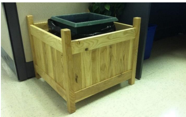
Du mobilier en frêne réalisé par les menuisiers de la Ville.