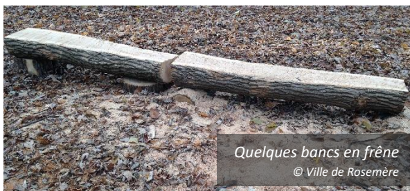
Quelques bancs en frêne

La Ville sélectionne les essences qu'elle donne de manière à favoriser la plantation d'arbres à grand déploiement.