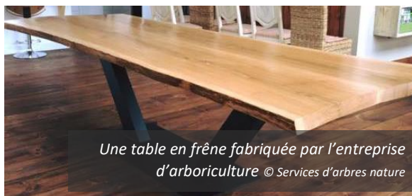
Une table en frêne fabriquée par l'entreprise d'arboriculture © Services d'arbres nature