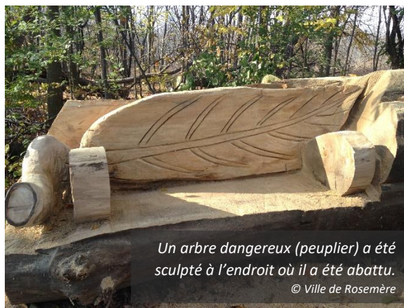
Un arbre dangereux (peuplier) a été sculpté à l'endroit où il a été abattu.

La Ville de Rosemère a fait abattre à l'hiver 2016-2017 une centaine de frênes par une compagnie d'arboriculture. Au niveau des frênes privés, ce sont les citoyens qui décident de la compagnie d'abattage avec laquelle ils font affaire. Les frênes en milieu privé sont au moins quatre fois plus nombreux que ceux situés sur des terrains publics. En 2016, des permis d'abattage ont été émis par la Ville pour environ 190 frênes. Les citoyens ne peuvent pas conserver le bois (à moins d'avoir enlevé l'écorce); ils doivent donc le donner à leur compagnie d'élagage ou encore le laisser sur place jusqu'à ce qu'il soit récupéré lors d'une collecte spéciale organisée par la Ville.