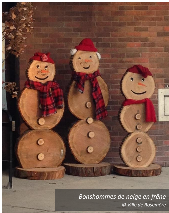
Bonshommes de neige en frêne

Le bois résultant des frênes abattus en parcs, en terrains municipaux et en emprises de rues est conservé par la compagnie d'abattage mandatée par la Ville. Les arbres abattus dans les boisés, peu nombreux, sont laissés sur place. Le bois des arbres privés est géré par les arboriculteurs qui effectuent le travail. Par ailleurs, la Ville de Rosemère propose à ses citoyens une collecte de branches gratuite quelques fois par année (collecte mensuelle d'avril à novembre); une compagnie externe est alors mandatée pour parcourir toutes les rues, déchieter le bois et en disposer conformément aux normes de l'Agence canadienne d'inspection des aliments et à la réglementation municipale en vigueur.