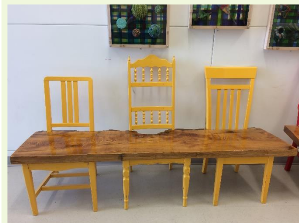
Bancs fabriqués par le personnel de Vaudreuil-Dorion © Ville de Vaudreuil-Dorion