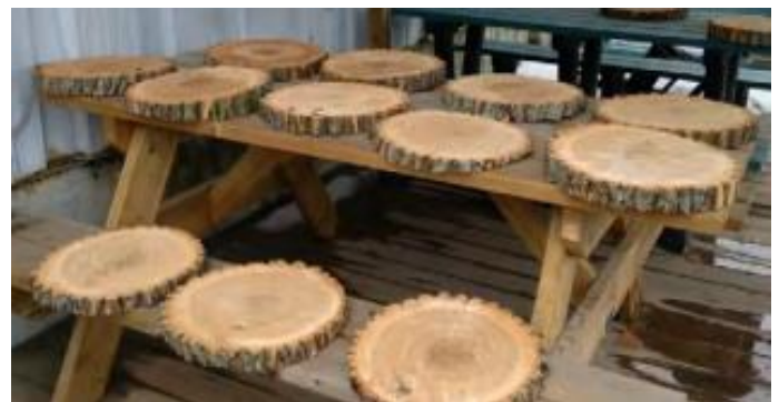
Un banc et des sous-plats réalisés par l'équipe des travaux publics